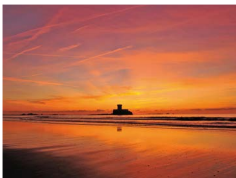
Sonnenuntergang über dem Atlantik