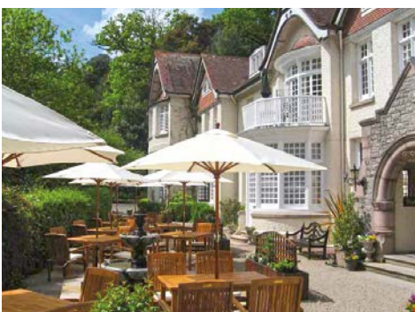
Cream Tea im „Chateau la Chaire“