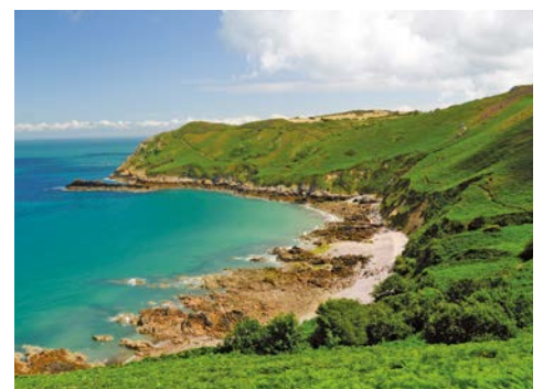
Grün bewachsene Felsküsten