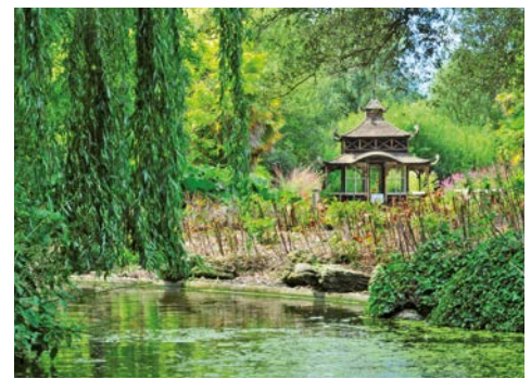
Japanischer Garten im Samares Manor

Transfer zum Flughafen Jersey und Rückflug nach Paderborn.