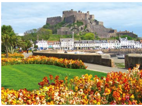
Jersey's Wahrzeichen: Mont Orgueil

und preisgekrönte Ausstellung erzählt in einem weitverzweigten unterirdischen Tunnelsystem die spannende Geschichte der Inselbewohner unter der deutschen Besatzung während des 2. Weltkrieges und erinnert eindrucksvoll mit O-Tönen und Original-Mobiliar an diese Zeit zurück. Für die Naturliebhaber unter Ihnen bieten wir unsere beliebte Klippenwanderung an - da waren sich bisher alle Gäste einig: dies war ein besonderes Highlight der Jersey-Reise!