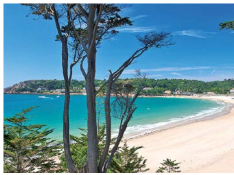
Endloser Sandstrand in der St. Brelade's Bay