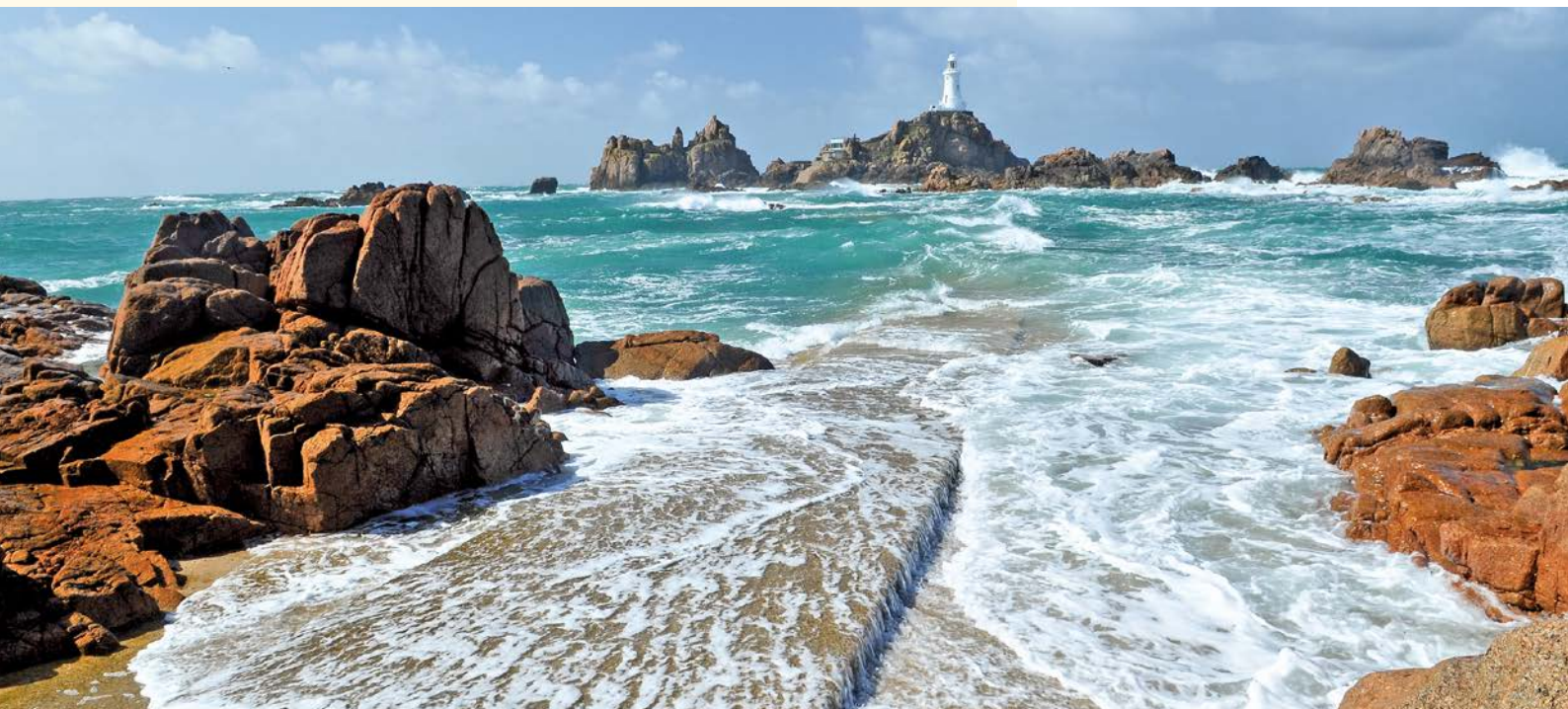
Meeresumspülter Felsenleuchtturm „La Corbière“

Ihr Ausflugsprogramm: St. Helier - St. Aubin - Brelade's Bay - Leuchtturm La Corbière - Weingut La Mare - Gardenroute - Samares Manor - Mont Orgueil Castle - Chateau la Chaire