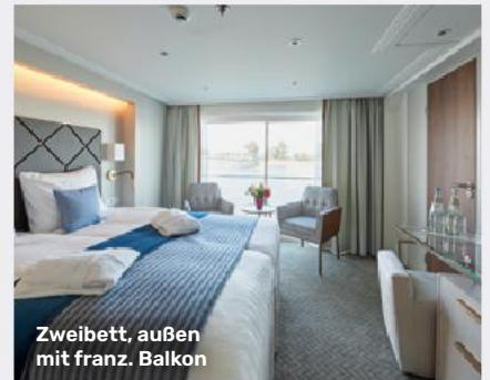
Zweibett, außen mit franz. Balkon