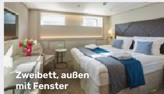
Zweibett, außen mit Fenster