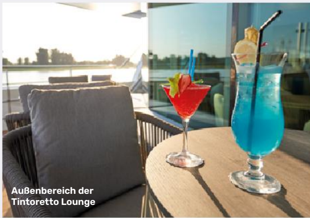
Außenbereich der Tintoretto Lounge