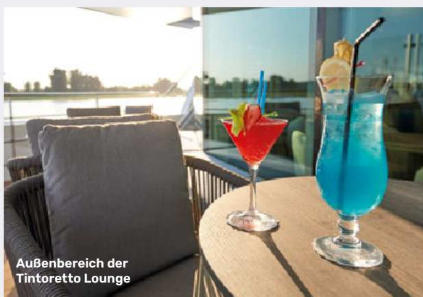
Außenbereich der Tintoretto Lounge