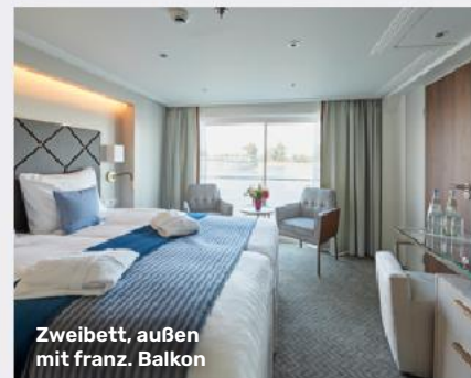
Zweibett, außen mit franz. Balkon