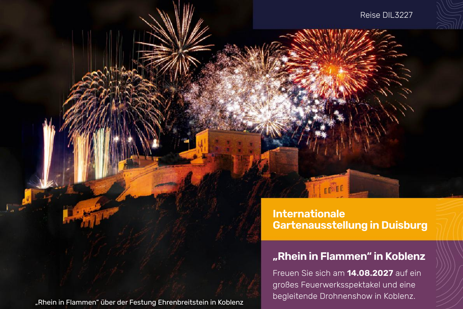
„Rhein in Flammen“ über der Festung Ehrenbreitstein in Koblenz