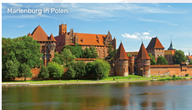
Marienburg in Polen