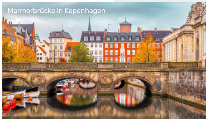
Marmorbrücke in Kopenhagen