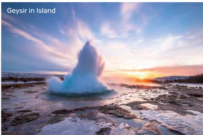
Geysir in Island

Nach der Passage des Prins Christian Sund malt Ihnen Grönland ein ebenso beeindruckendes Bild – mit schneeweißen Eisbergen, tiefblauem Meer, schwarzen Felsformationen und kunterbunten Siedlungen. Sagen Sie den treuherzigen Schlittenhunden Guten Tag, entdecken Sie den grandiosen Eisfjord per Pedes, Boot oder Flugzeug und düsen Sie mit dem Zodiac über den Strømfjord. Abenteuer – wir kommen!