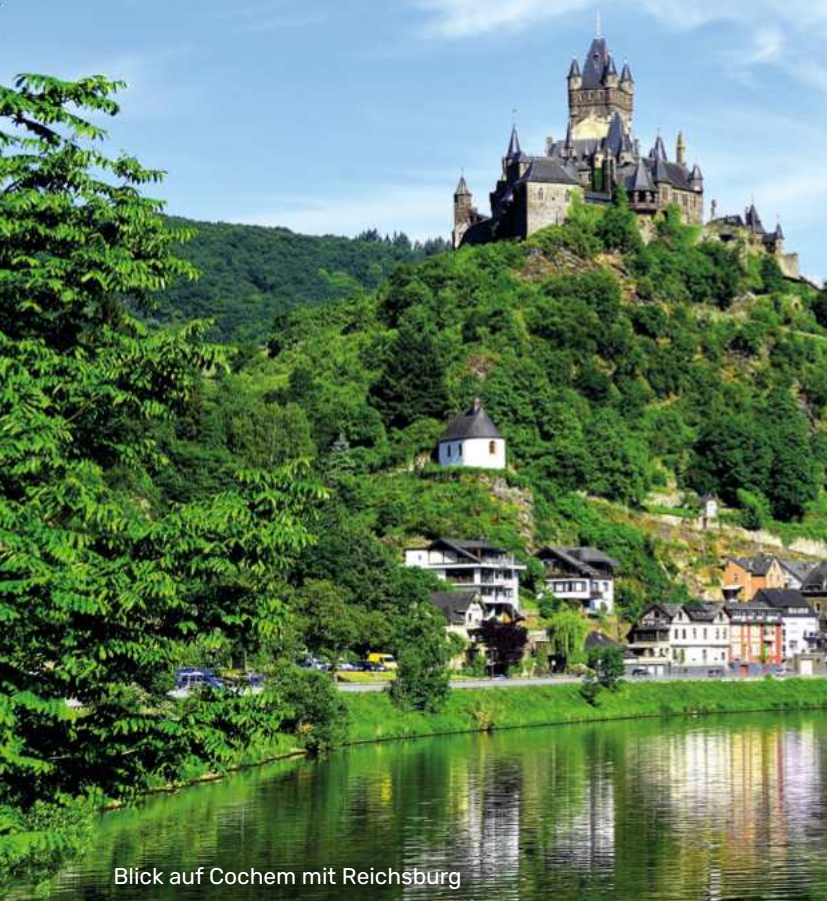
Blick auf Cochem mit Reichsburg