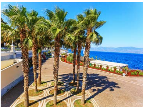
Promenade von Reggio Calabria

Reisepreis: € 990,- pro Person im Doppelzimmer