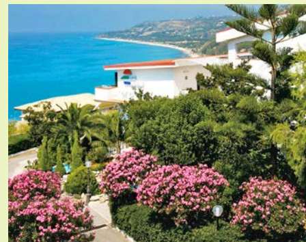
Ausblick vom Hotel Santa Lucia