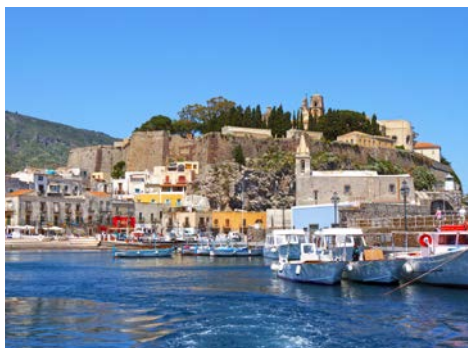
Im Hafen von Lipari (Zusatzausflug)

Der Zusatzausflug besteht aus einer kleinen und entspannten Kreuzfahrt entlang der Inselkette, zu der einige der schönsten Inseln des Mittelmeeres gehören. Der erste Halt des Ausflugs ist Stromboli, die Heimatinsel des 900 Meter großen gleichnamigen Vulkans. Die ursprünglichen Dörfer Stromboli und das Fischerdorf Gonostra beherbergen die einzigen Einwohner des Eilands. Dabei bieten sich die örtlichen Strände aus feinem Lavasand wunderbar zum Ausruhen und Baden ein. Weiter geht es nach Lipari, der bevölkerungsreichsten und größten der Äolischen Inseln. Die gleichnamige Stadt gilt als kulturelles und ökonomisches Zentrum der Inselkette – hier kann man wunderbar Einkaufen gehen, einen Spaziergang durch die engen Gassen unternehmen