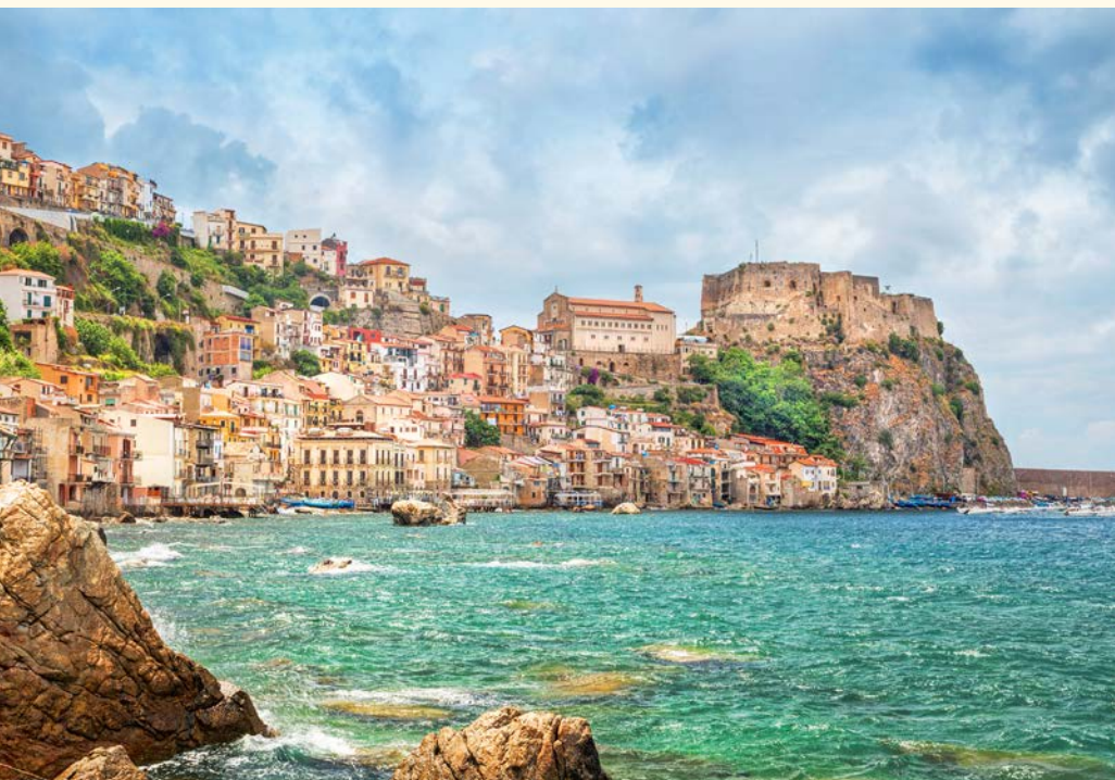
Scilla mit Castello Ruffo