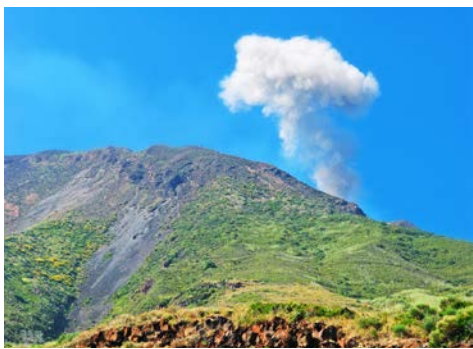
Blick auf den Stromboli