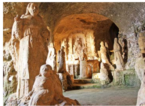
Chiesa di Piedigrotta