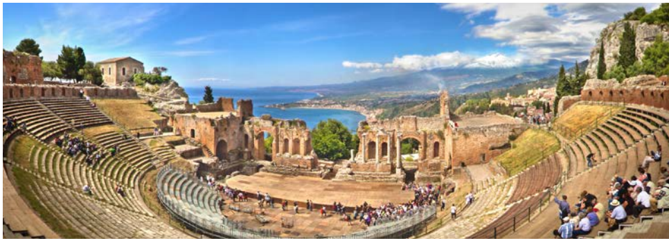
Das Freilichttheater in Taormina (Zusatzflug)