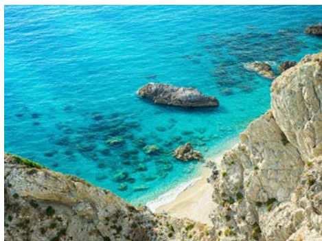
Die kalabrische Küste