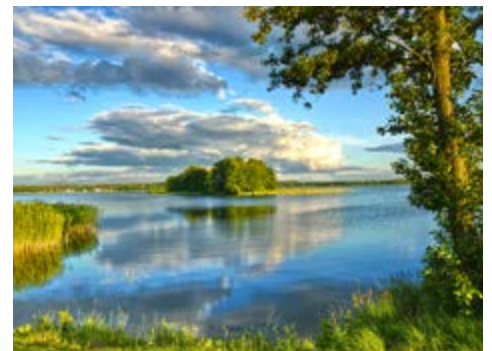
Die Landschaft Masurens