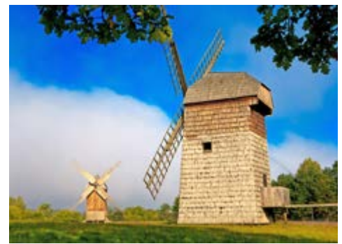
Alte Windmühlen in Masuren

Heute heißt es leider Abschied nehmen von der malerischen Seenlandschaft der Masuren. Sie fahren zum Flughafen nach Danzig und fliegen zurück nach Paderborn.