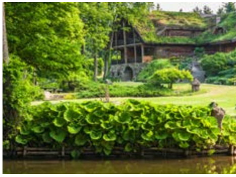
Impressionen entlang der Krutynia

Nach dem Frühstück verlassen Sie Danzig und besichtigen zunächst die etwa 60 Kilometer entfernte Marienburg an der Nogat, einem Mündungsarm der Weichsel. Die Ordensburg war im 14. und 15. Jahrhundert der Sitz der Hochmeister des Deutschen Ordens und zählt heute zu den größten