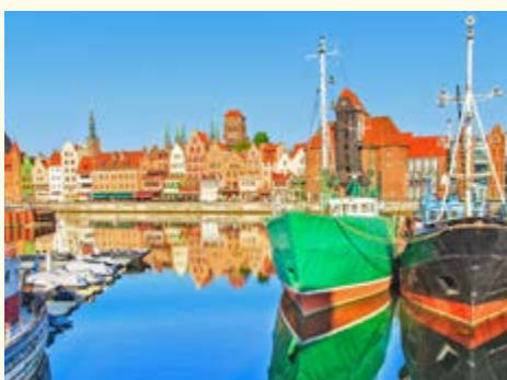
Blick auf die Danziger Altstadt