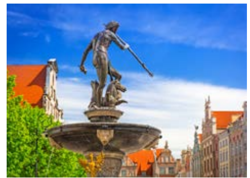
Der Neptunbrunnen in Danzig