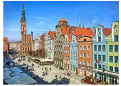
Langer Markt in Danzig

Kirche im typischen Holzbaustil bewundern. Im kleinen Dorf Kruttinnen tauchen Sie schließlich in die unberührte Natur der Masuren ein. Während einer idyllischen Stocherkahnfahrt auf dem glasklaren Urwald-Flüsschen Kruttina können Sie seltene Tierarten wie Fischotter, Eisvögel oder Baumrarder beobachten und genießen ein wahrlich einmaliges Naturerlebnis. Sie genießen die herrliche Landschaft und durchqueren die Naturidylle der Masuren gen Norden bis zum alten Kirchdorf Nikolaiken, das mit seinen vielen Kanälen auch als „Venedig der Masuren“ bekannt ist. Grillabend im Hotel.