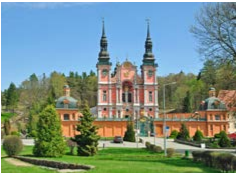
Wallfahrtskirche in Heiligelinde