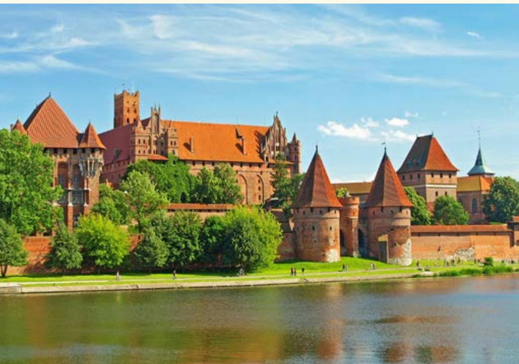
UNESCO Welterbe Marienburg

Danzig - Marienburg - Mohrungen - Peitschendorf - Eckertsdorf - Kruttinnen - Rudzanny-Nieden - Nikolaiken - Heiligelinde - Rastenburg mit Wolfsschanze - Zondern - Allenstein Zusatzausflug: Oliva - Zoppot - Gdingen - Kaschubische Schweiz